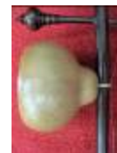
พิณน้ำเต้า

ในภาคกลางมีการทำเครื่องดนตรีพื้นบ้าน เช่น พิณน้ำเต้า ทำมาจากน้ำเต้าและไม้ชิงชัน ซอสามสายทำจากลูกมะพร้าว ไม้คูนและนางพญาจิวดำ ส่วนกลองแขกทำมาจากไม้มะริด พะยูง ประดู่ และกระพี้เขาควาย