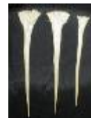
ต้น และ แปรงสีฟันจากกิ่งหนามโกทา

ในภาคใต้ถือว่ามะพร้าว ( Cocos nucifera L.) เป็นไม้มงคลและควรปลูกไว้ทางทิศตะวันออก ด้วยความเชื่อว่ามีเมื่อดูปลูกไว้บริเวณบ้าน จะทำให้ไม่มีการเจ็บไข้และอยู่เย็นเป็นสุข ส่วนประเพณีอาบน้ำศพของชาวไทยมุสลิมภาคใต้ พืชที่ใช้อาบน้ำศพได้แก่ ใบพุทรา ใบมะลิ หรือใบข่อย